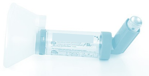
Câmara expansora com máscara facial

Manter a máscara bem adaptada à face até 20-30 segundos após pressionar o inalador.