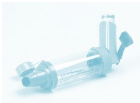
Câmara expansora com peça bucal

Fazer apneia (não respirar) de 10 segundos após inalação única ou respirar com o bocal bem adaptado durante 20-30 segundos após pressionar o inalador.